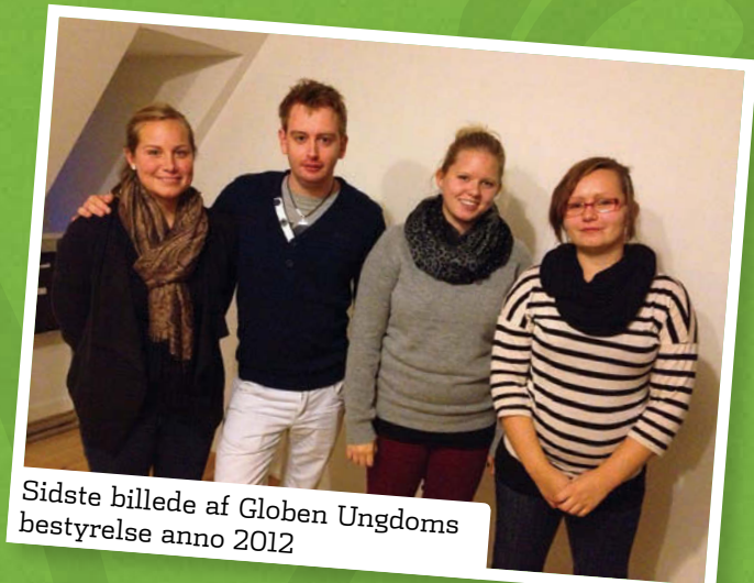
Sidste billede af Globen Ungdoms bestyrelse anno 2012